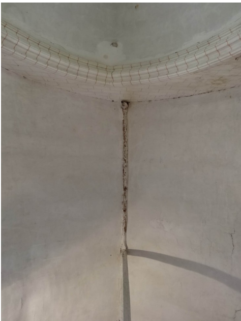
Epreville en Lieuvin (voûte plâtrée)