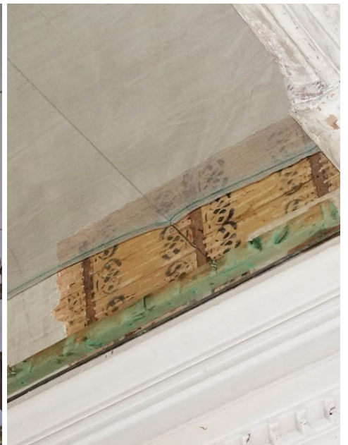
Ambenay (merrains peints sous le plâtre)