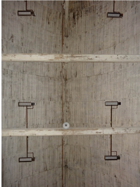
Jouy sur Eure