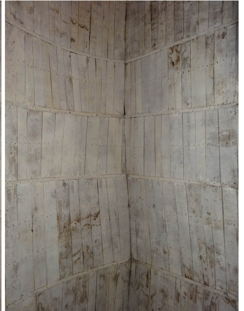
Jouy sur Eure (colatéral)