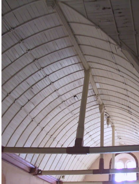
Saint Germain sur Avre